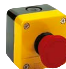
Interruttore di arresto d'emergenza IP67 10382V000 cfr. pagina 93